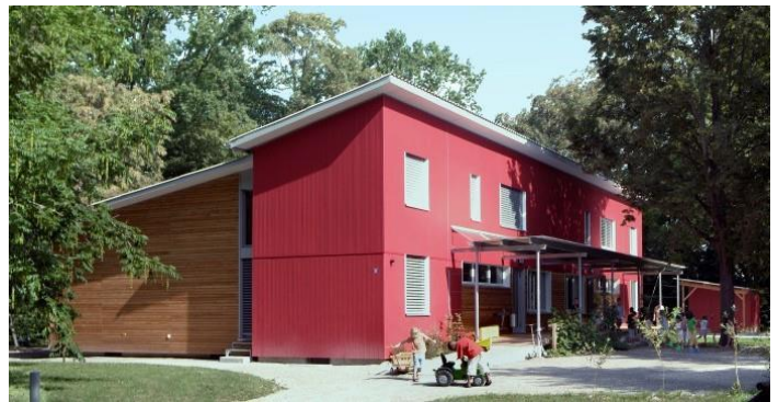
Kindergarten «Hauental» in Schaffhausen (2008) © Reich + Bächtold Architekten SWB

Siehe dazu Factsheet: FSC® Projektzertifizierung